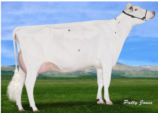
BLUE-HORIZON JCKMN BABYDUST GRANDDAM